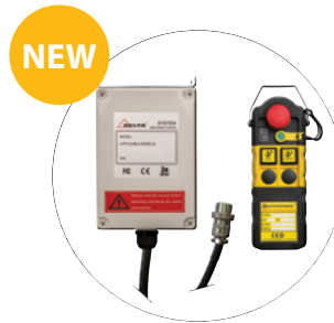
plug & play Funksteuerung / télécommande plug & play